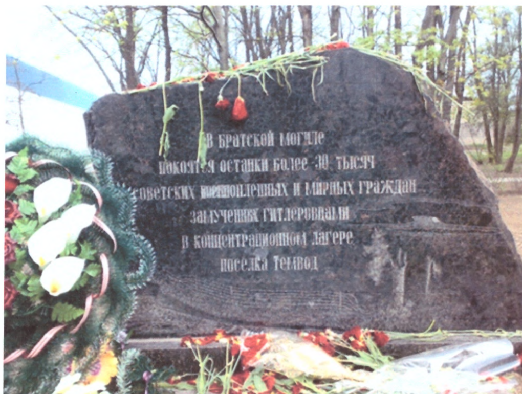
Пам'ятник в'язням «Шталагу-364»