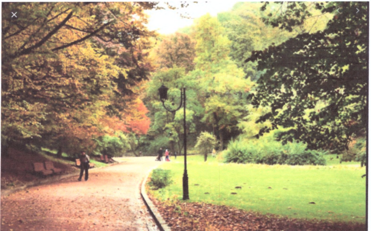
Варіанти Парків Пам'яті і Примирення