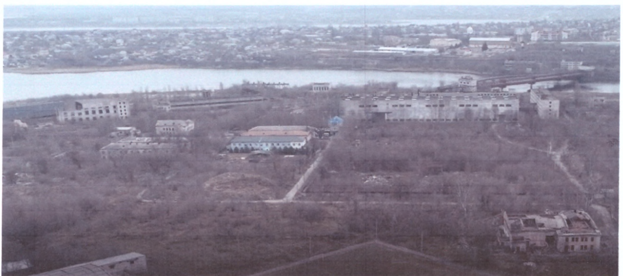
Стан території сьогодні